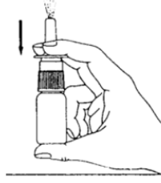
Şekil 2: Sadece ilk kez kullanılırken, sprej görünene kadar birkaç kez püskürtünüz.